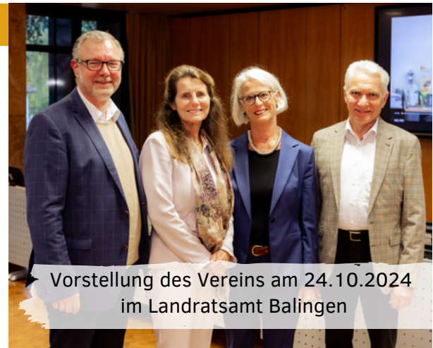
Vorstellung des Vereins am 24.10.2024 im Landratsamt Balingen

Interessierte können sich auf www.mentor-zollernalb.de informieren oder ein Gespräch (Tel.: 07435 910 393) vereinbaren.