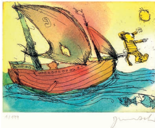
© Janosch film & medien AG